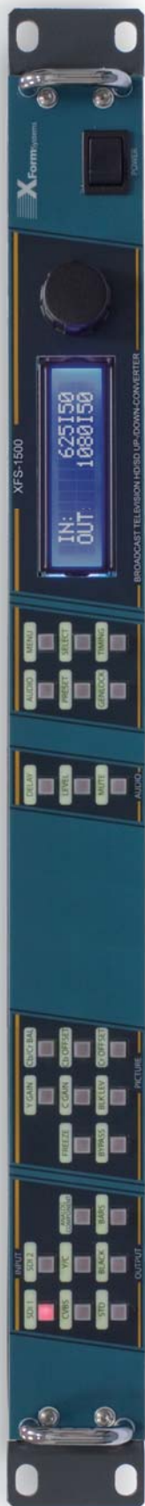
(基本配置不包含本地控制面板)