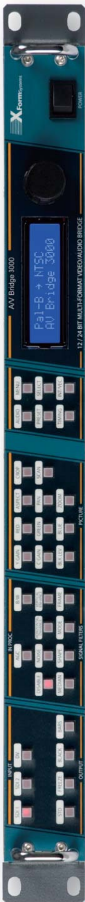
(基本配置不包含本地控制面板)